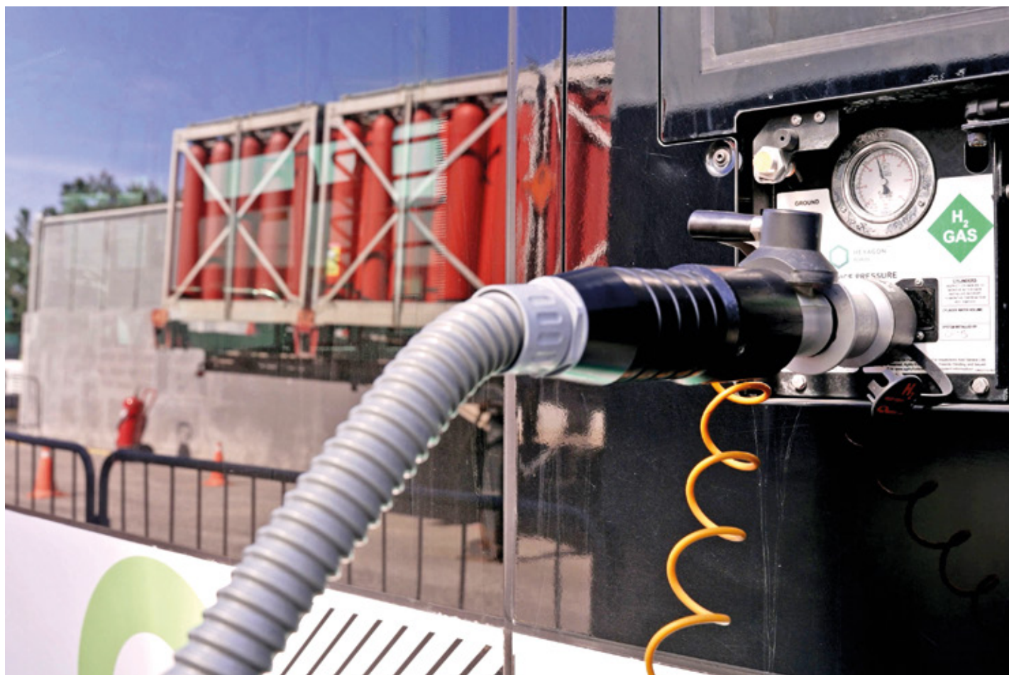
Die erste Wasserstofftankstelle Portugals wurde von der Gemeinde Cascais zur Betankung ihrer Wasserstoffbusse errichtet